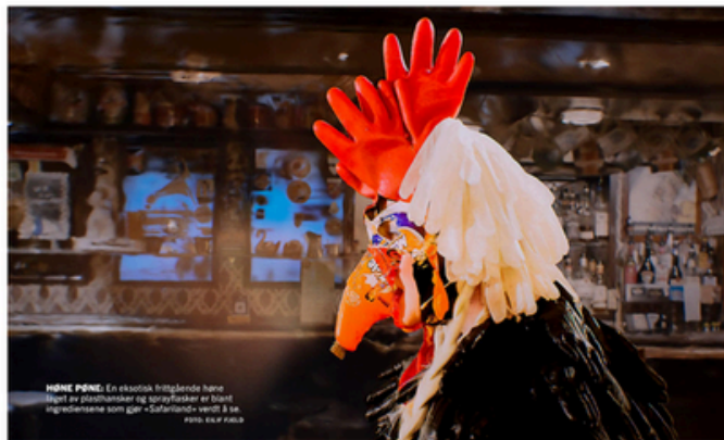
HJØNE PØNDEL. En eksotisk frivillende hene laget av plasthanser og sprayfarger er blant figurene i «Safariland» som gjer «Safariland» verd å se.

https://www.nobelpeacecenter.org/pressemeldinger/teater-i-kirkenes-er-manedens-dialogstemme