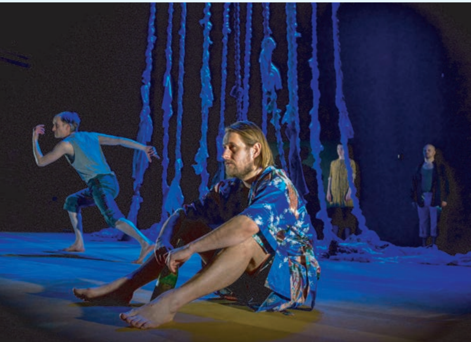
Lost in the Horizon 2023

Resten av kunstnerisk team: se hjemmeside