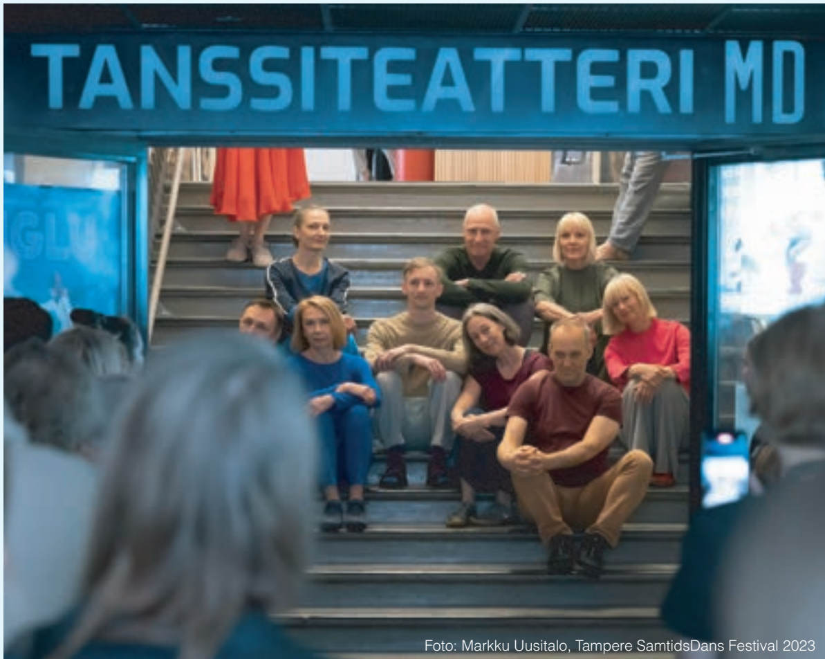
Tampere SamtidsDans Festival 2023