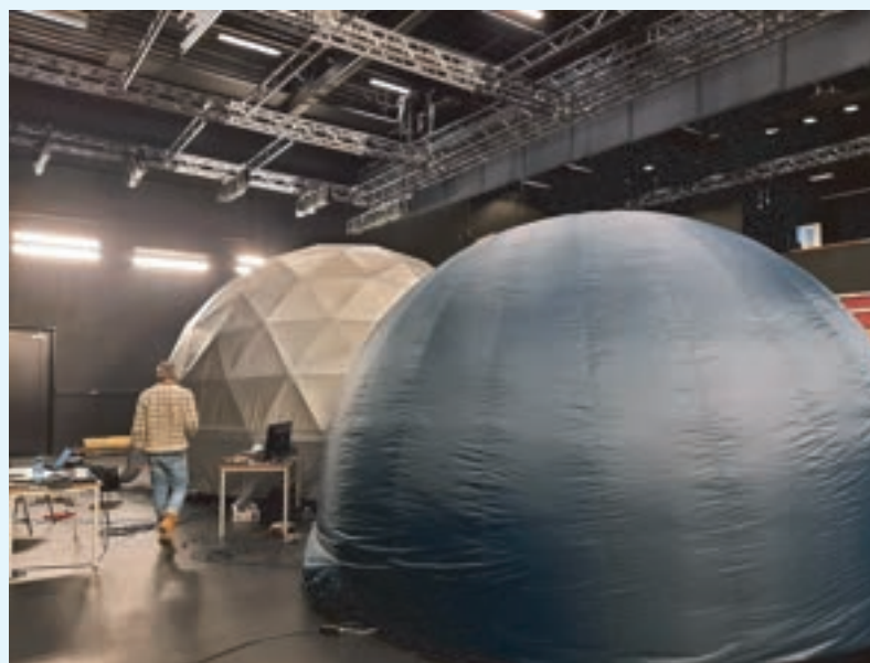
ZøvnZaun 2023

ZøvnZaun er en interaktiv teaterforestilling om søvnmangel. Forestillingen tar for seg søvnmangel som et symptom på det moderne samfunnet som krever at vi er tilgjengelige og produktive 24/7. Samtidig utforsker ZøvnZaun det å ha kontroll og å gi fra seg kontroll i et ukontrollerbart kontroll-samfunn. Med hjelp av audiovisuelle og vibrerende elementer stiller forestillingen spørsmål rundt samfunnets kapitalisering av helse.