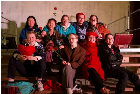
Fra forestillingen «Under the arctic skin» inne på Malmklang

I tillegg til den profesjonelle driften, har Samovarteateret alltid jobbet med barn og unge, både i Sør-Varanger, Norge, Barentsregionen, Norden og Europa. Vi ser på dette som et viktig samfunnsområde og mandat. For å utvikle et samfunn må man begynne med de unge, og vi ser det som viktig å gi dem en tidlig forkjærlighet til kunsten og kulturen. De unge tilfører også oss som teater og samfunn veldig mye, og er et viktig satsningsområde.