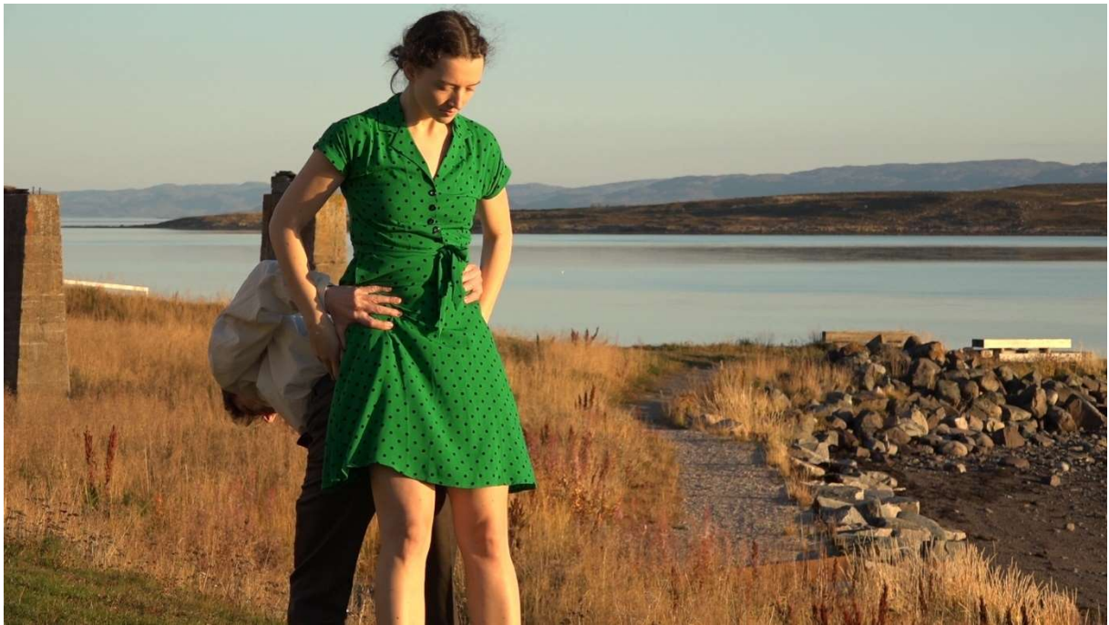
Fra «Skår – av tro, håp og kjærlighet» i prosess i 2021.